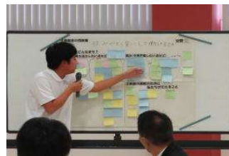
函館市未来デザインワークショップ

また、生徒の安心・安全を支える体制づくりにも全力を注いでまいりました。スクールカウンセラーの活用やステップアップ・プログラム事業を通じ、多角的な支援を行っています。今年度のいじめ認知件数は一件でしたが、これは生徒の些細な変化や訴えを教職員が組織として早期に捉え、迅速な対応に繋がった結果であると認識しております。今後も「いじめを許さない見逃さない」姿勢を堅持し、生徒一人ひとりが大切にされる居場所づくりを徹底してまいります。