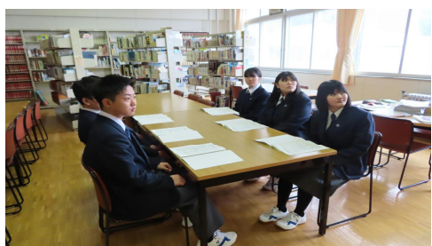
新入生オリエンテーション